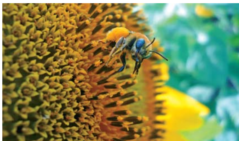
Figura 11. Las plantas silvestres que crecen en los bordes de un lote sembrado con girasol proporcionan un hábitat para polinizadores de ese cultivo, como la abeja que muestra la figura anterior.