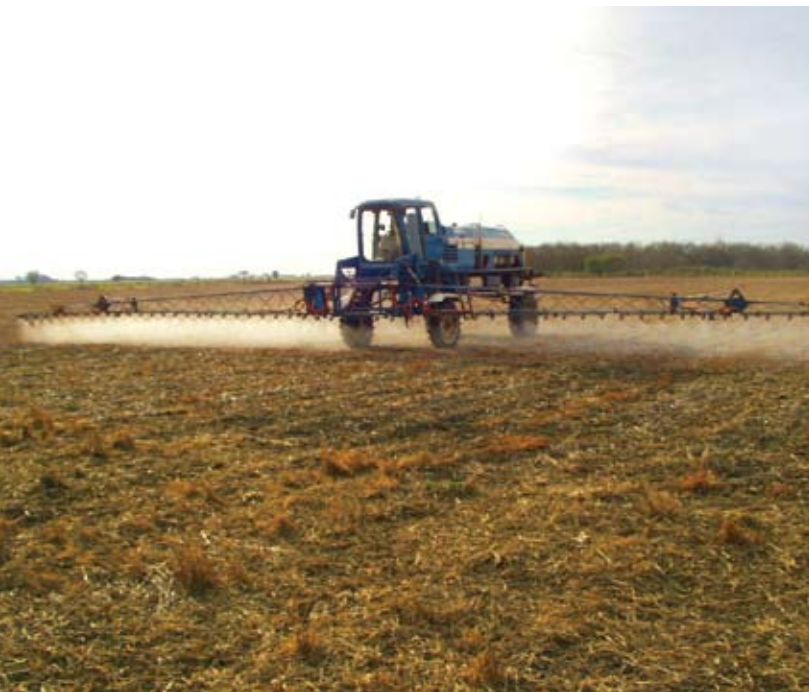
Figura 9. El uso de productos agroquímicos en las tareas agrícolas mejora los rendimientos de los cultivos, pero también reduce la abundancia de polinizadores y su diversidad. En Salta, una pulverizadora autopropulsada realiza un barbecho químico, nombre que se da al control de malezas antes de la plantación o siembra.

constatados en flores sin esa exposición. Las primeras produjeron, en promedio, un 9% más frutos que las no polinizadas. Además, en ausencia de abejas se triplicó la incidencia de frutos malformados, lo que ocasionó una merma del 21% en los frutos con valor comercial. La polinización de ese tipo de cultivos resulta importante para muchas economías regionales, ya que su escala es pequeña o mediana y generan ingresos en el ámbito local.