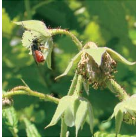
Polinizador silvestre (posiblemente la abeja nativa Ruizanthedella mutabilis ) visitando flores de frambuesa.

En una plantación próxima a El Bolsón, los autores de este artículo relevamos el porcentaje de flores que se transforman en frutos y el porcentaje de frutos malformados, es decir, registramos la cantidad y la calidad de la fructificación de flores expuestas a polinizadores. Comparamos esos datos con los mismos indicadores