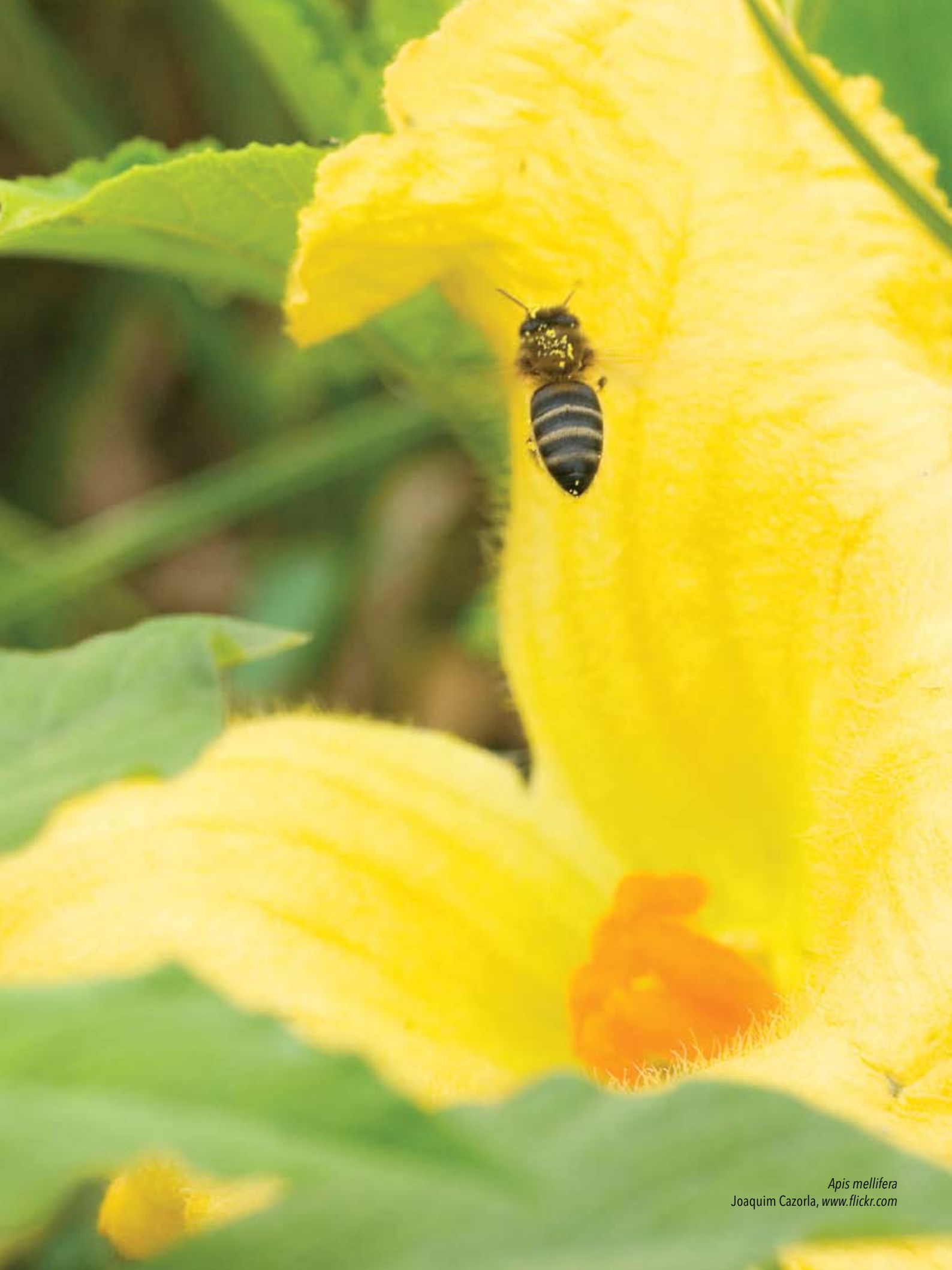
Apis mellifera Joaquim Cazorla, www.flickr.com