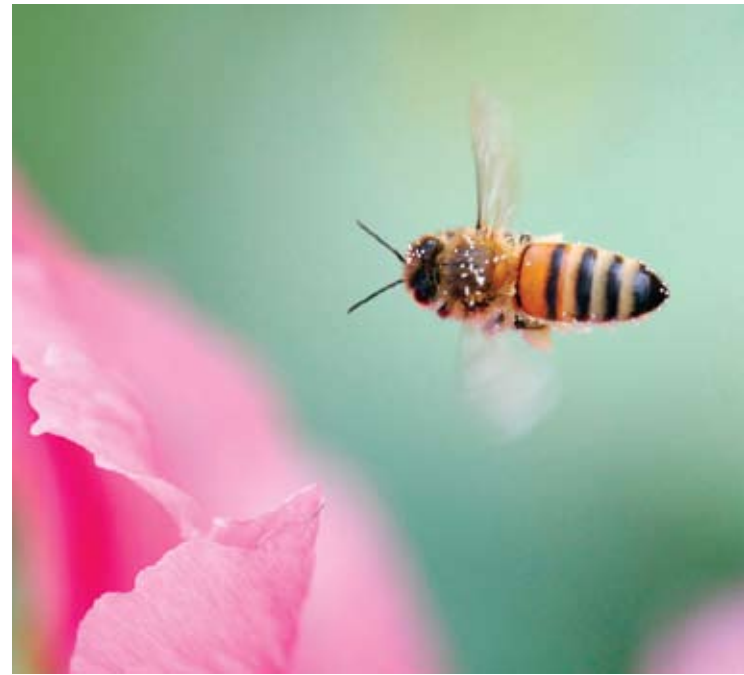
Figura 2. Una abeja transporta de una flor a otra el polen que se le adhirió cuando ingresó en la primera para succionar néctar.

(figuras 1 y 2). Cuando la polinización es exitosa, el polen depositado en el estigma germina y forma tubos que transportan los gametos masculinos a través del estilo hasta alcanzar los óvulos en el ovario. Entonces, los óvulos —que contienen los gametos femeninos— resultan fertilizados.