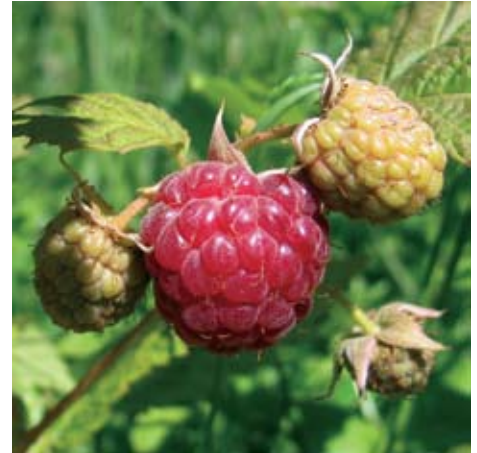
Planta de frambuesa con frutos.

constatados en flores sin esa exposición. Las primeras produjeron, en promedio, un 9% más frutos que las no polinizadas. Además, en ausencia de abejas se triplicó la incidencia de frutos malformados, lo que ocasionó una merma del 21% en los frutos con valor comercial. La polinización de ese tipo de cultivos resulta importante para muchas economías regionales, ya que su escala es pequeña o mediana y generan ingresos en el ámbito local.