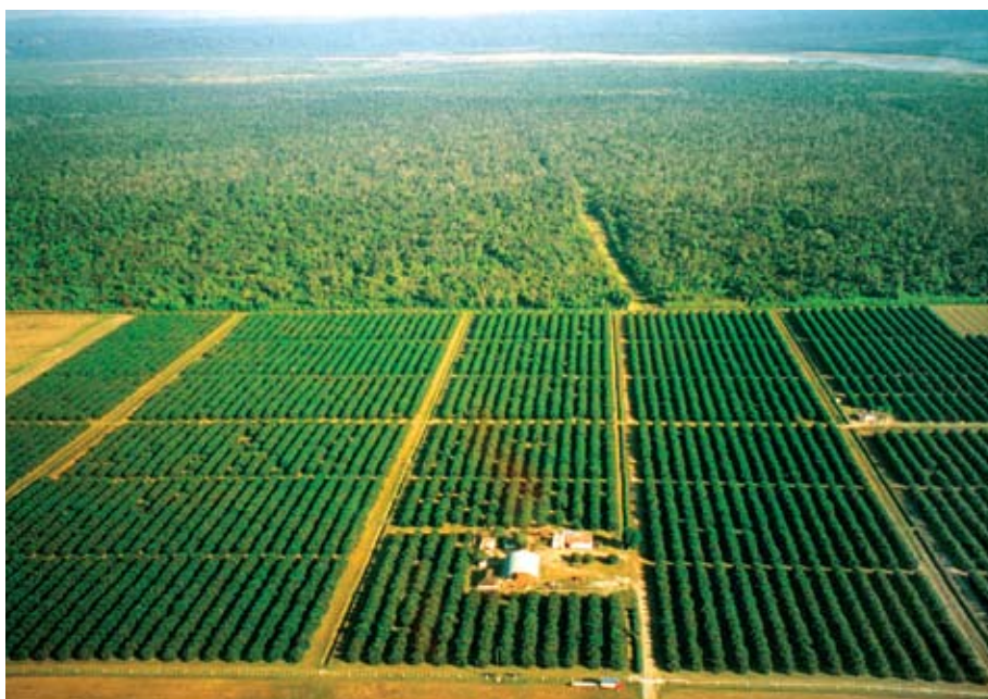
Plantaciones de cítricos en tierras lindantes a selva nativa en las cercanías de Orán, Salta.

Flores de pomelo de árboles cercanos a la selva recibieron, en promedio, el doble de visitas por parte de un grupo de polinizadores tres veces más diverso que flores ubicadas a un kilómetro. La abeja melífera africanizada, vuelta silvestre en la región y visitante principal de las flores de pomelo, también fue menos abundante a distancias mayores de 500m de la selva. La mayor disminución ocurrió entre los visitantes nativos, como abejas sin aguijón o meliponas y abejas solitarias, que desaparecieron casi completamente a pocos cientos de metros de la selva. Estas disminuciones se observaron a lo largo de tres años y en plantaciones alejadas entre sí hasta 50km, por lo que concluimos que serían habituales en la región.